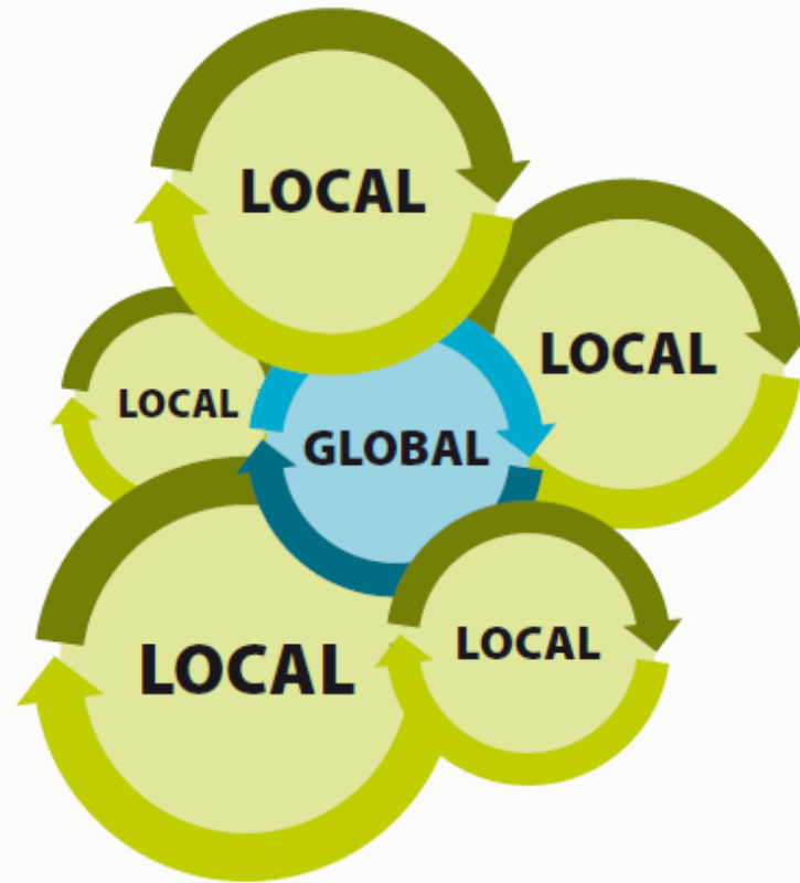
Picture 2: In 2050, real time trading systems enable a glocal world economy.

http://www.sitra.fi/julkaisut/muut/Distributed_BioBased_Economy.pdf